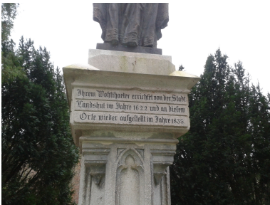
Wer steht denn auf diesem Sockel? Und wo?

Pubquiz erfreuen sich in Landshut großer Beliebtheit. Da wird es Zeit für eine Quiztour durch die Stadt!